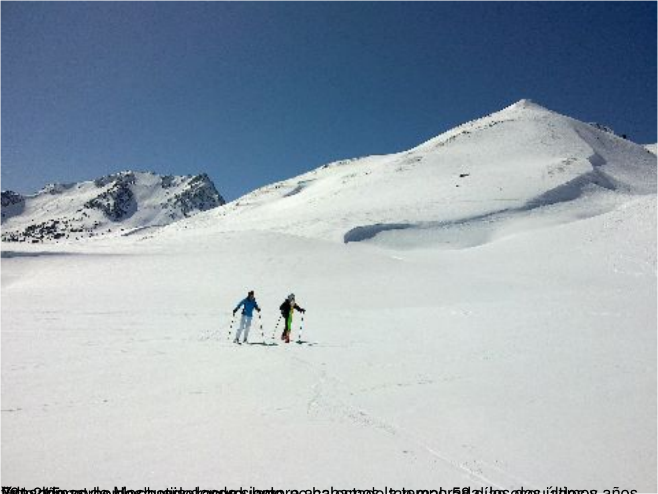
Estación de Mosateiro de las Alpujarras, en la sierra de Guadarrama, a principios de la temporada de esquí, años 80.