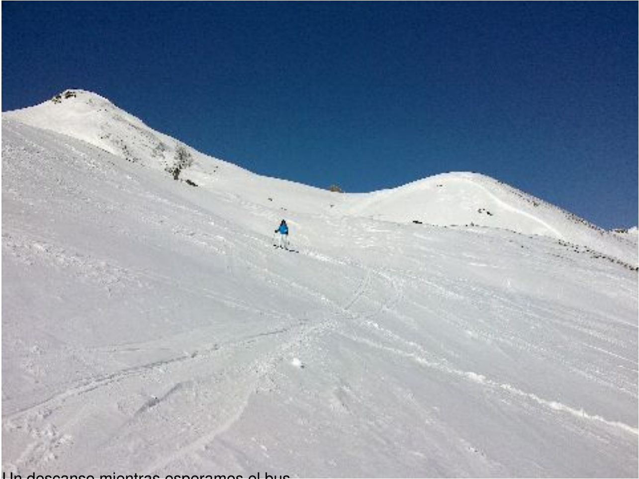
Un descanso mientras esperamos el bus...