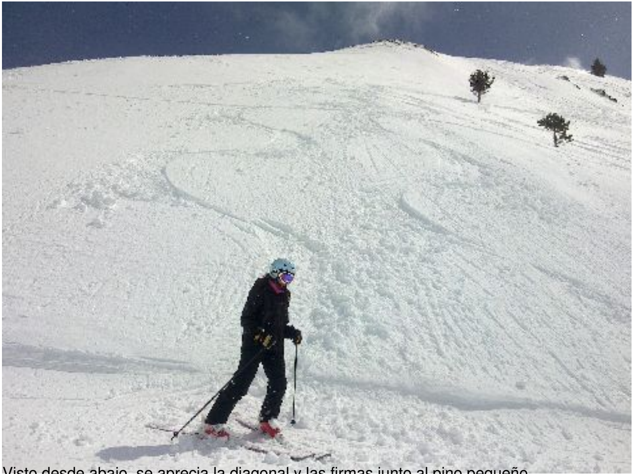
Visto desde abajo, se aprecia la diagonal y las firmas junto al pino pequeño.