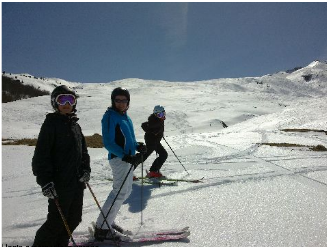
Hasta pronto y feliz verano.