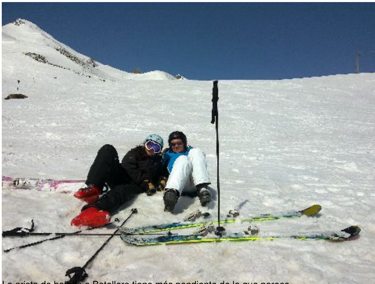
La arista de bajada a Batallero tiene más pendiente de lo que parece.